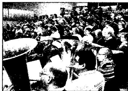
Dimanche 18 mars Répétition à Angers