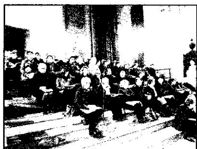
Samedi 7 et Dimanche 8 avril, concerts en l'église de la Trinité à ANGERS