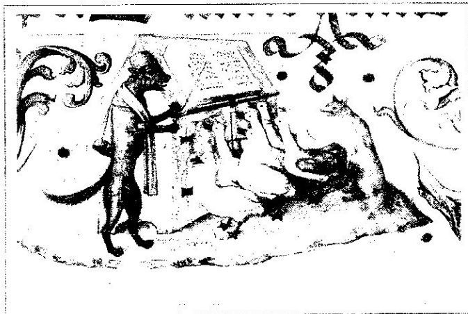
Yvonne a déniché cette image du chœur

Image tirée du Livre des Oies * paru à Nuremberg ( Allemagne) entre 1503 et 1510 . On y voit un chœur d'oies dirigé par un loup. À l'arrière un renard semble les garder réunies mais une patte est déjà dangereusement posée sur l'une d'entre elle !!!